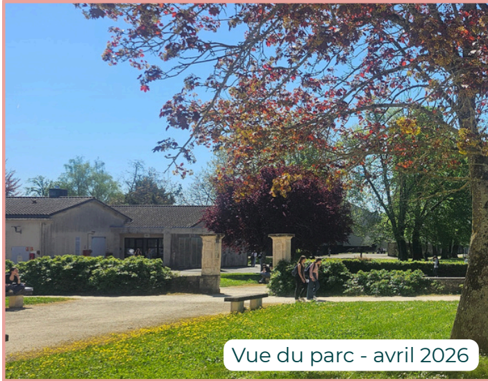
Vue du parc - avril 2026